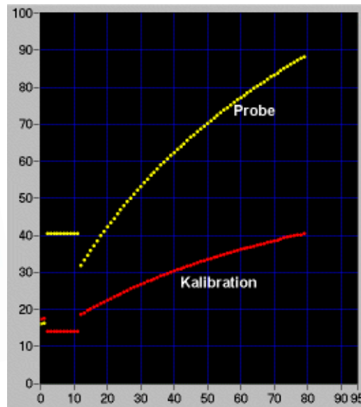
CL-10 mit PC Anbindung zur Probenmessung und Visualisierung des kompletten Reaktionsverlaufs (Essigsäure - Fixzeit Methode)

Das Modell CL-10 SELECT ist ein universelles Messgerät für sehr schnelle enzymatische Untersuchungen in Ausbildung, Lehre, Forschung und Produktion.